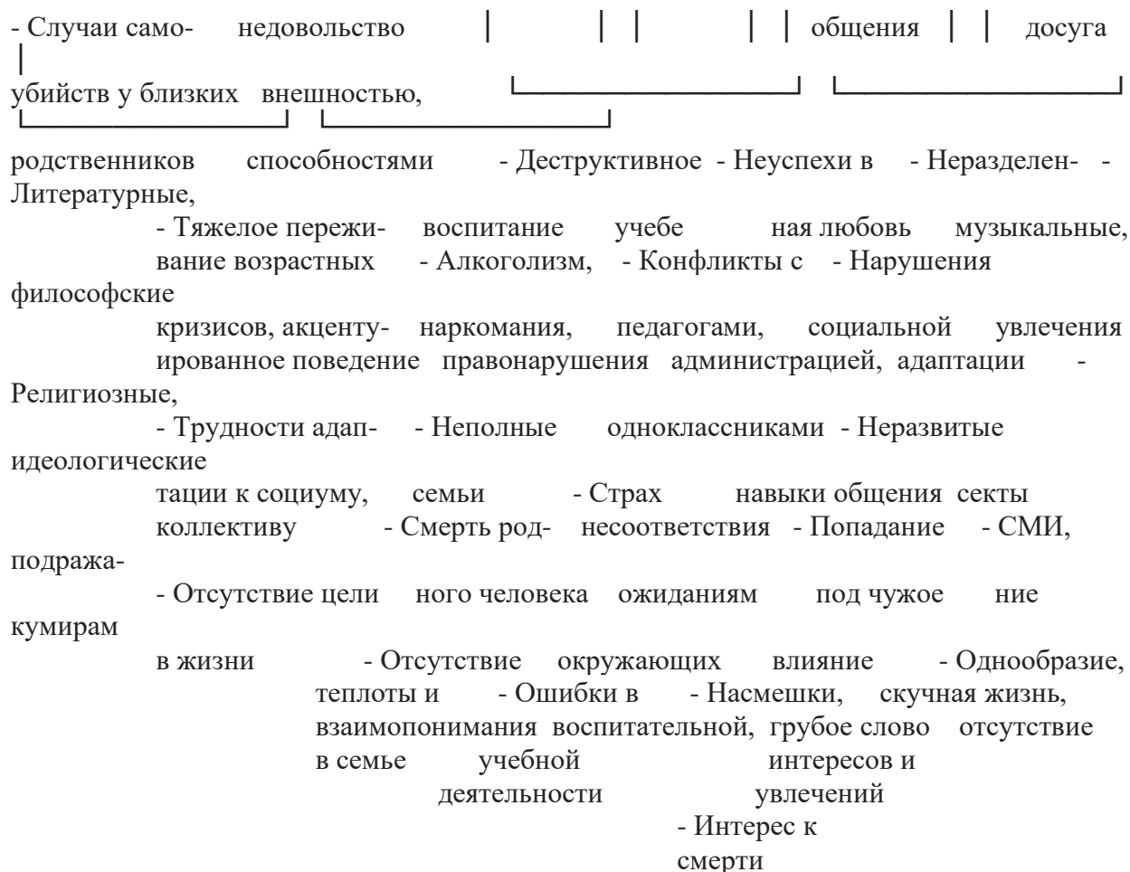
Рис. 1. Факторы суицидального риска

Группы суицидального риска - это подростки: